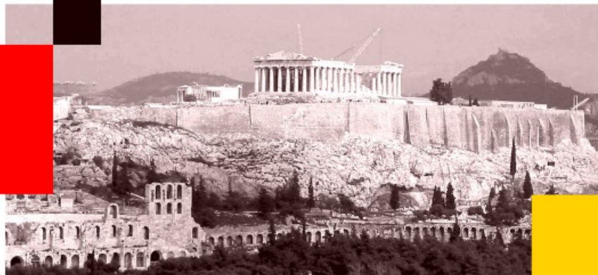
Das Referenzmodell für Systementwicklungsprojekte in der Bundesverwaltung Version: 2.0